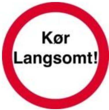
Kør langsomt. Skilt