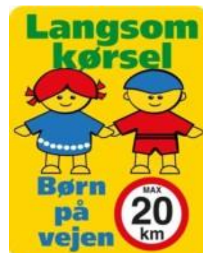
Langsom kørsel børn på vejen max20 km. Skilt