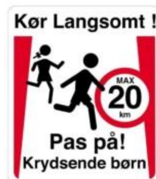
Kør langsomt Pas på krydsende børn børn max 20 km. Skilt