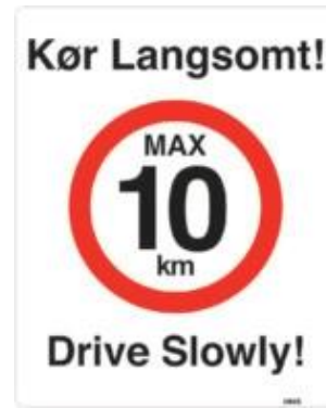
Kør langsomt. Max 10 km. Drive slowly. skilt