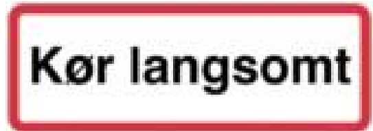
Kør langsomt. Trafikskilt