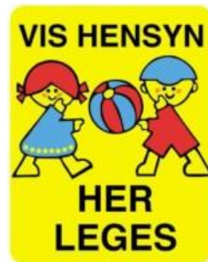
Vis hensyn her leges. Skilt