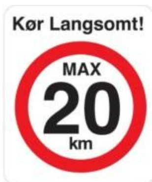
Kør langsomt max 20 km Skilt