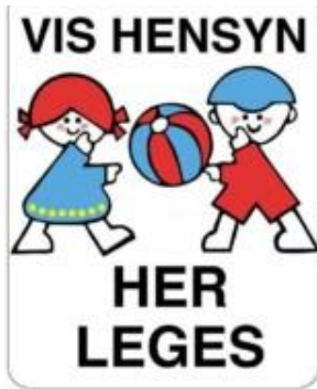
Vis hensyn her leges. Skilt