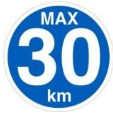
Max 30 km Skilt