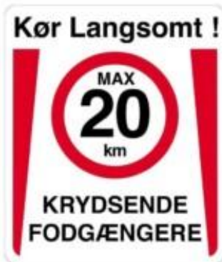
Kør langsomt max 20 km Krydsende fodgængere Skilt