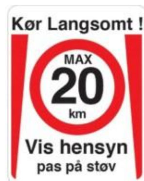
Kør Langsomt vis hensyn pas på støv . Fartdæpendeskilt