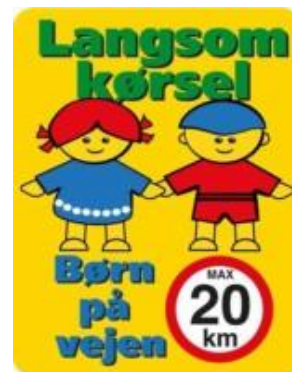
Langsom kørsel børn på vejen max20 km. Skilt