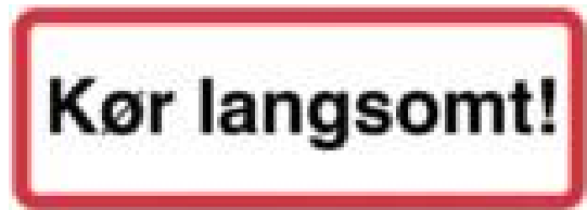
Kør langsomt!. Skilt