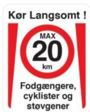
Fodgængere, cyklister og støvgener. Fartdæmpendeskilt