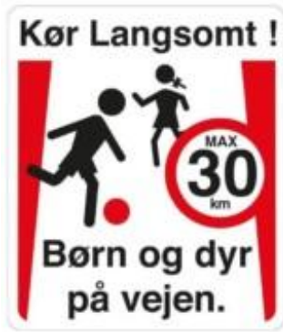
Kør langsomt Børn og dyr på vejen max 30 km Skilt