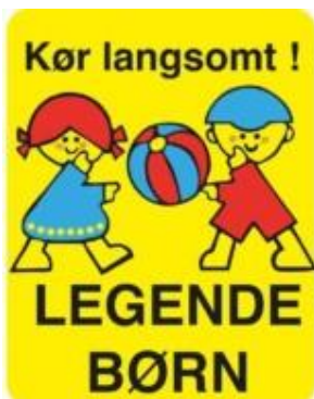
Kør langsomt skilt