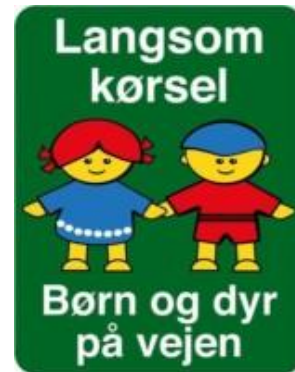
Langsom kørsel Børn og dyr på vejen Skilt