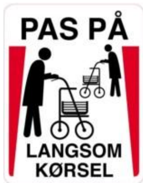
Pas på Langsom kørsel. Advarselsskilt