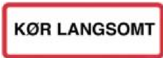
Kør langsomt . Skilt