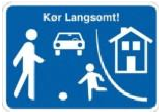
Kør langsomt. Skilt